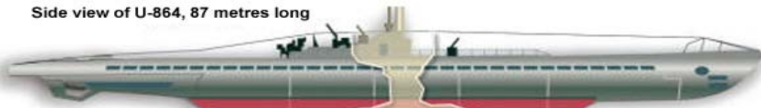
Side view of U-864, 87 metres long

The keel, total 55 metres (red color) is containing the Mercury bottles. The middle part, 10-12 metres is not found yet, and can contain about 17 tons of Mercury.